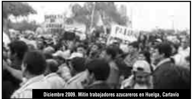
Diciembre 2009. Mitin trabajadores azucareros en Huelga, Cartavio

Presentamos a continuación la declaración del Núcleo de Obreros Revolucionarios de Perú ante la heroica huelga de los obreros de Cartavio, declaración adoptada por la Liga Trotskista Internacionalista de Perú y por el Secretariado de Coordinación Internacional de la FLTI. A su vez publicamos en esta sección el intercambio de correspondencia del SCI con el NOR interviniendo en común en la lucha de los trabajadores peruanos, avanzando en un reagrupamiento internacionalista de los revolucionarios en lucha contra las direcciones traidoras, para que las masas avancen en el inicio de la revolución peruana. Finalmente publicamos las últimas adhesiones a la campaña internacional por la libertad de los mineros presos en las cárceles del asesino Alan García y el régimen pro imperialista del TLC.