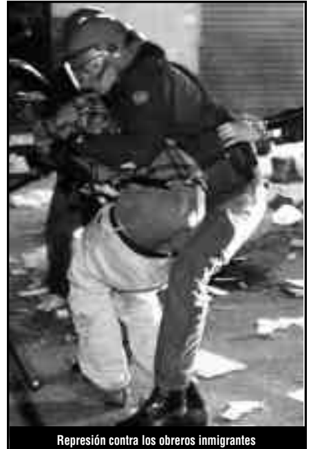
Represión contra los obreros inmigrantes

¡Por la unidad de la clase obrera europea en comi-