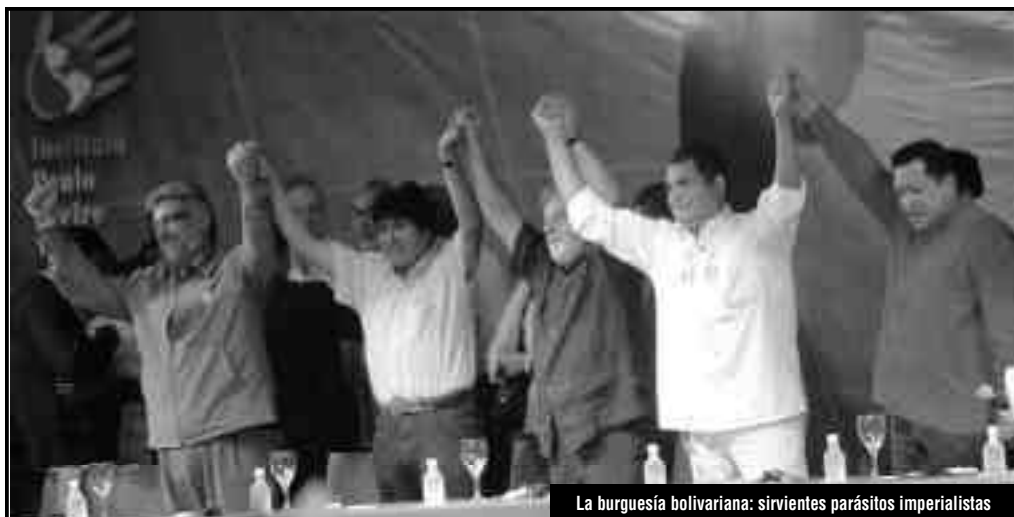
La burguesía bolivariana: sirvientes parásitos imperialistas

¡Los que cacarean sobre la independencia de clase fueron justamente los que hicieron la campaña por los 10 millones de votos para la reelección del "comandante" Chávez en el 2006! Así durante años sostuvieron y fortalecieron a los gobiernos bolivarianos, con su apoyo "crítico", como parte del Foro Social Mundial de Castro, Lula, Morales, Correa, etc., para que después de la expropiación