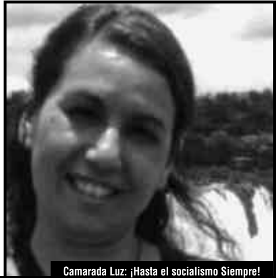
Camarada Luz: ¡Hasta el socialismo Siempre!