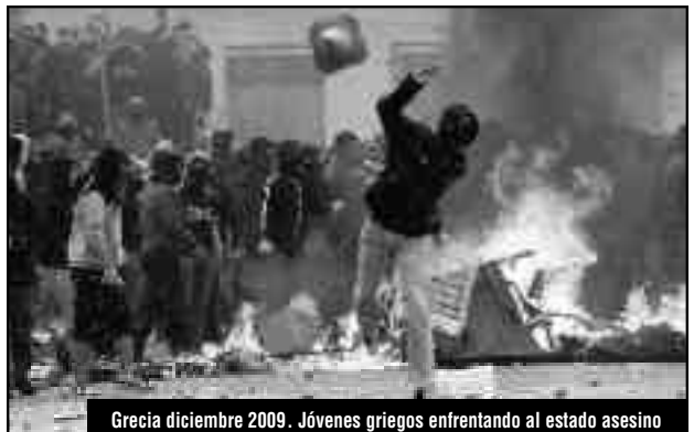
Grecia diciembre 2009. Jóvenes griegos enfrentando al estado asesino

tuvieron y les pegaron que no tengan miedo y vayan a un juzgado a hacer la denuncia, se puede lograr que intervengan la comisaría, se identifique a todos los policías que estuvieron en el operativo y al jefe que dio la orden de esta represión dirigida". ¡El problema no son 2 o 3 manzanas podridas, son todos perros de presa, asesinos a sueldo al servicio de la patronal y el gobierno! Se desnudan como lo que son: ¡La izquierda del frente democrático! ¡Basta! ¡Con estas direcciones no se puede pelear, mucho menos pensar en triunfar!