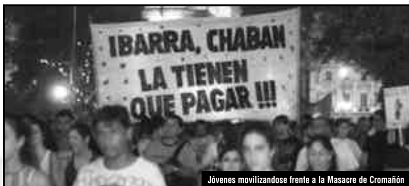
Jóvenes movilizándose frente a la Masacre de Cromañón

Lejos ha quedado aquel enero caliente del 2005 donde temblaron todas las instituciones del régimen burgués por la lucha llevada adelante por los sobrevivientes, amigos y familiares de Cromañón que salían a las calles junto a la juventud trabajadora y