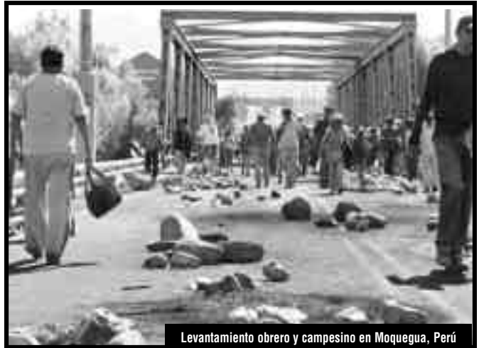
Levantamiento obrero y campesino en Moquegua, Perú

Camaradas del NOR, vuestra posición ha sido adoptada como propia por este secretariado internacional de la