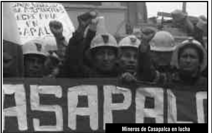
Mineros de Casapalca en lucha

Ustedes advertían claramente el rol de las direcciones traidoras. Esa valentía de "decir las cosas como son, ser audaces en el momento de la acción" como dice el "Programa de Transición", nos acercan más a las masas que cualquier maniobra y