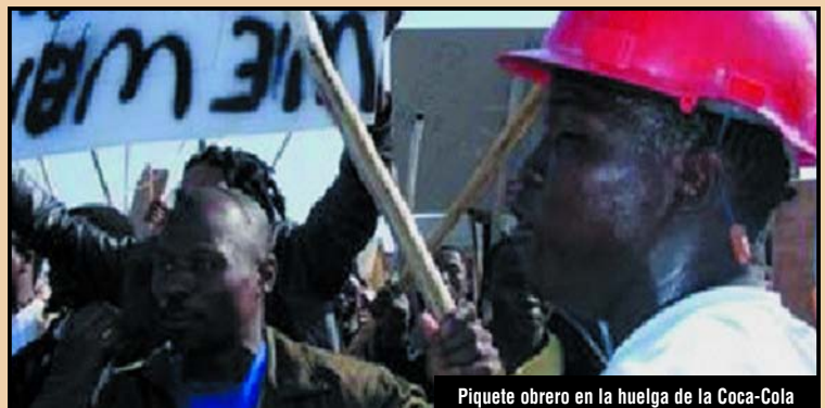
Piquete obrero en la huelga de la Coca-Cola

Apoyamos el llamado a la inmediata reincorporación de todos los huelguistas despedidos por Sun International.